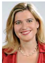
Melanie Huml MdL Staatssekretärin