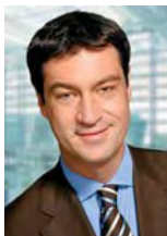
Dr. Markus Söder MdL Staatsminister

Gerne haben wir aus Mitteln der Gesundheitsinitiative Gesund.Leben.Bayern. den Baby-Kompass gefördert. Wir sind sicher, dass er wertvolle Hilfestellungen leisten wird und wünschen Ihnen als Eltern viel Freude dabei, Ihre Kinder hoffentlich gesund und munter aufwachsen zu sehen.